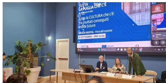
Cultura e futuro: la Puglia punta sul welfare culturale In Fiera del Levante il bilancio di cinque anni della Puglia e le sfide del domani